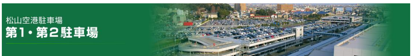
松山空港駐車場 第1・第2駐車場